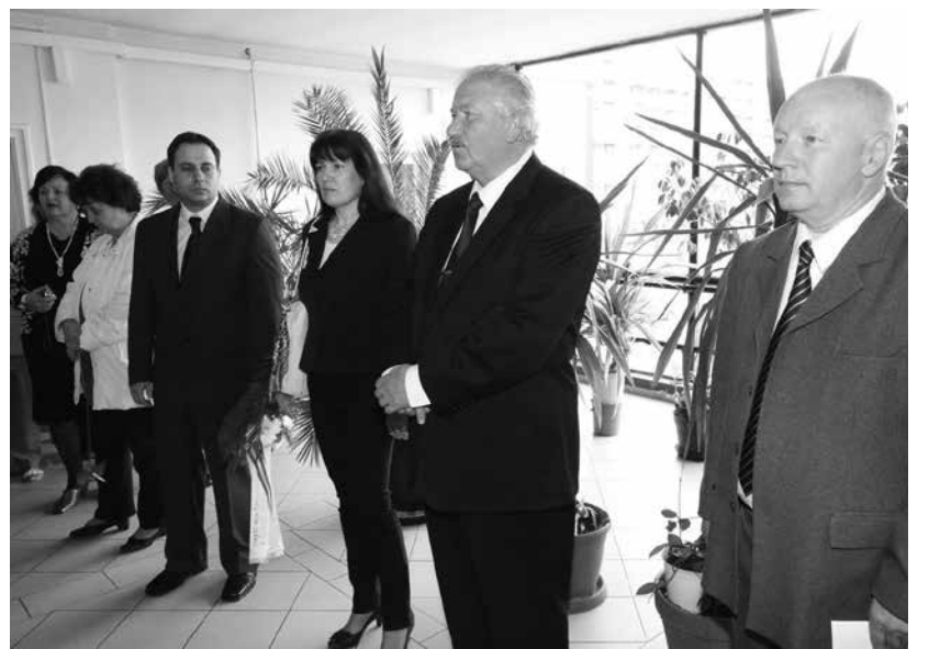
Tisztelgés a munkabalesetek áldozatai előtt.