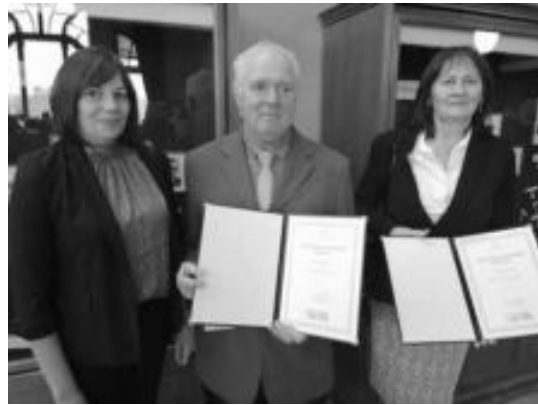
KLUDI Szerelvény Kft. Öntöde/Présüzem.