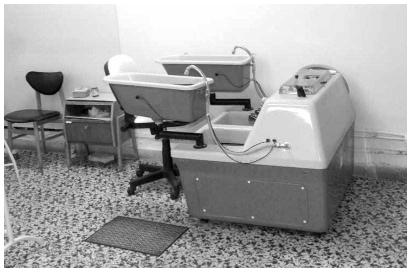
Ezeket túl a Szanatóriumban található korszerű medencében súlyfürdő-

Az iszapakkolás - másnéven gyógy föld - legjellemzőbb tulajdonsága a jó hőtároló képesség és hő leadás. Ennek hatására kitágulnak az erek, gyorsul az anyagcsere, a gyulladások csökkennek, az izmok és az inak ellazulnak, a görcsök feloldódnak. A fizioterápia, ami a gyógyításban a természet energiáit alkalmazza jótékony hatással van a szervezet különféle bajaira. A galvánfürdőnek fájdalomcsillapító és értágító hatása van.