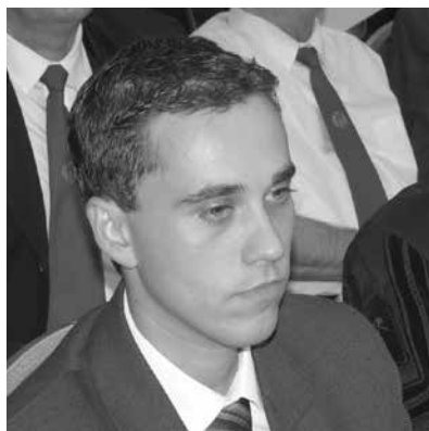
A legfiatalabb ...