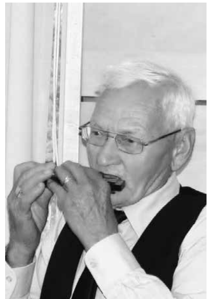
... és a legidősebb küldött.