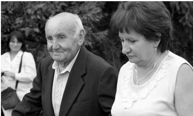
Tisztelet és elismerés a szakszervezettől a hűségért. Mátranovákon, a megyei bányásznapon.

férjét fogadó, kiszolgáló asszonyt, a tisztaszobát, a házakat, amelyeket már vályogból, kőből építettek, s mutatja a szorgos asszonykezek készített mesés kézimunkákat, a szövött vásznakat és az emberek szorgos munkáját elismerő kitüntetések.