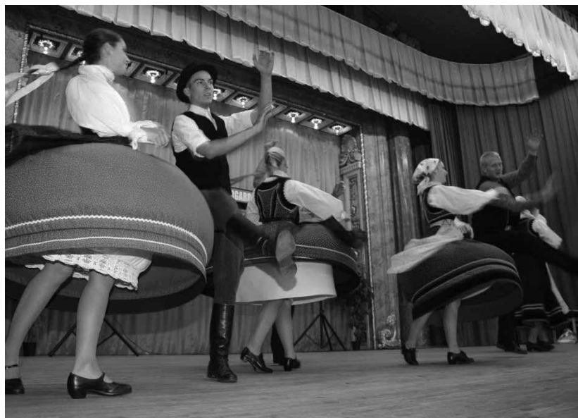
Az Ajka-Padragkúti Táncegyüttes