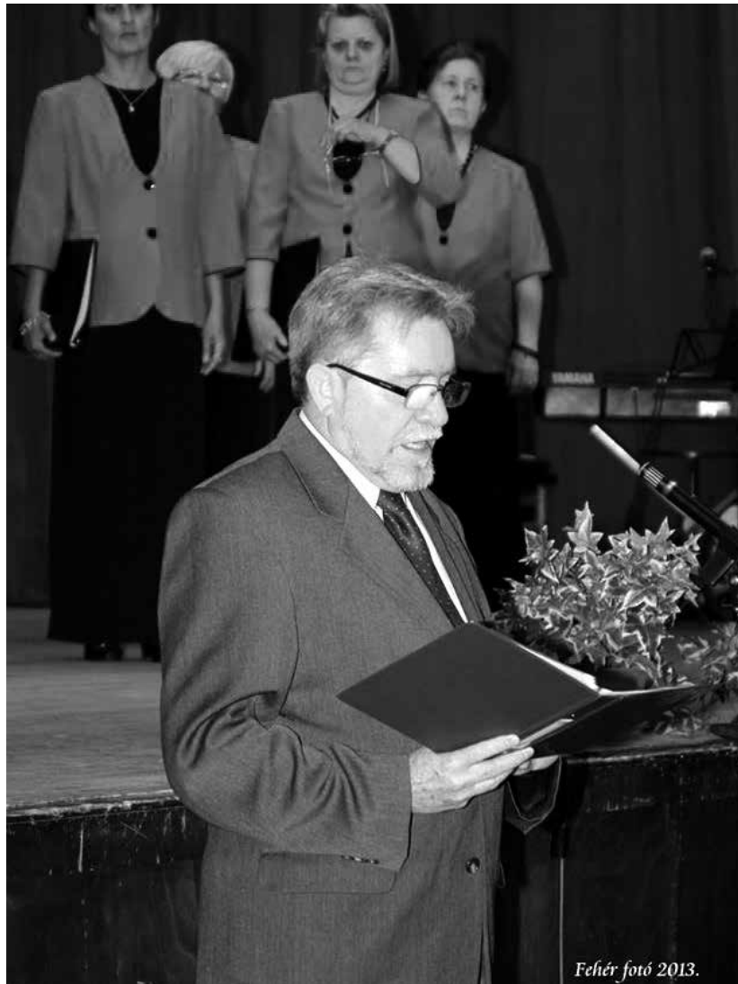
Feltér fotó 2013.

Azt hiszem, a bányászati szektor nagyon sokat köszönhet a magyar bányászatnak, a jelenlévő bányászati képviselőknek, de – ott fenn a galérián – a nemzetközi szervezetek képviselőinek is. Az együttműködés megmutatja azt, hogy nemzetközi szolidaritás révén mit lehet