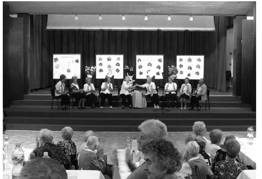
A negyedszázad élmény-kútjából bőven mergették az asszonyok