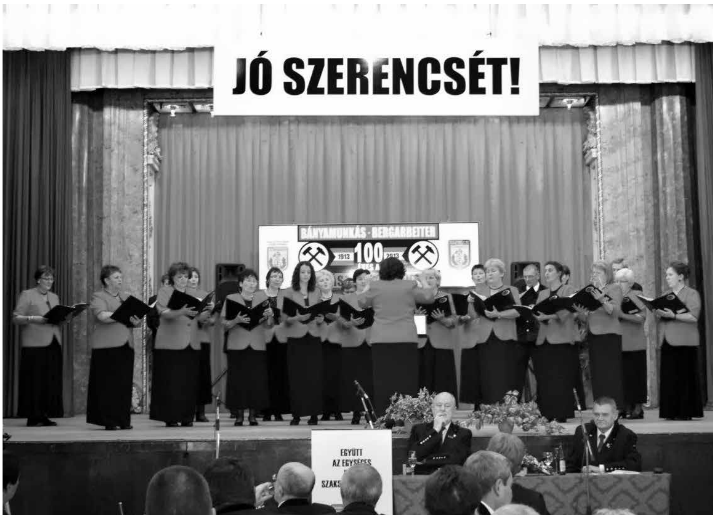
Az Ajka-Padragkúti Forrás kamarakórus

adjon Isten jó szerencsét a bányamunkásnak!”