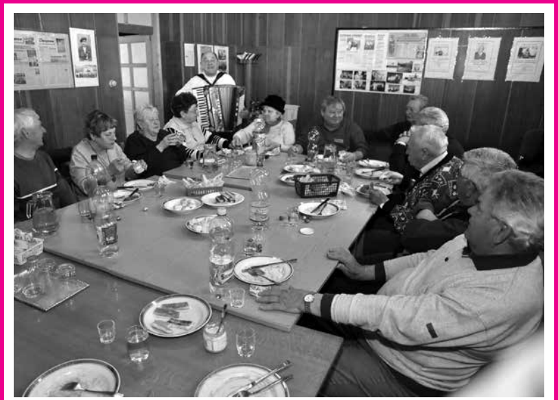
Megtartotta első negyedéves ülését az Ajkai Bányász nyugdíjas Alapszervezet bizalmi testülete. Értékeltek az eredményes tagdíj-munkát, majd ünnepélyesen köszöntötték az első félévben névnapjukat tartó tagjaikat.