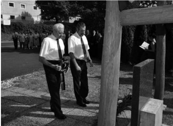
A padragi Nyugdíjas Baráti kör képviselői koszorúznak