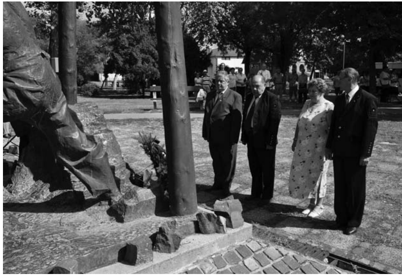
A bányász emlékmű koszorúozása a Hild-parkban

Az ünneplő közönség a parkerdei Bányászati Múzeum kertjében folytatta a megemlékezést. A szénbányászat és eróműves áldozatok emlékére felállított kopjafánál lehajtott fejjel tisztelegtek az előtt a 175 ember márványba vésett emléktáblája előtt, akik társaikhoz hasonlóan bizakodva szálltak le a föld mélyébe, de feljönni már nem tudtak többé, befejezetlenül hagyták életük