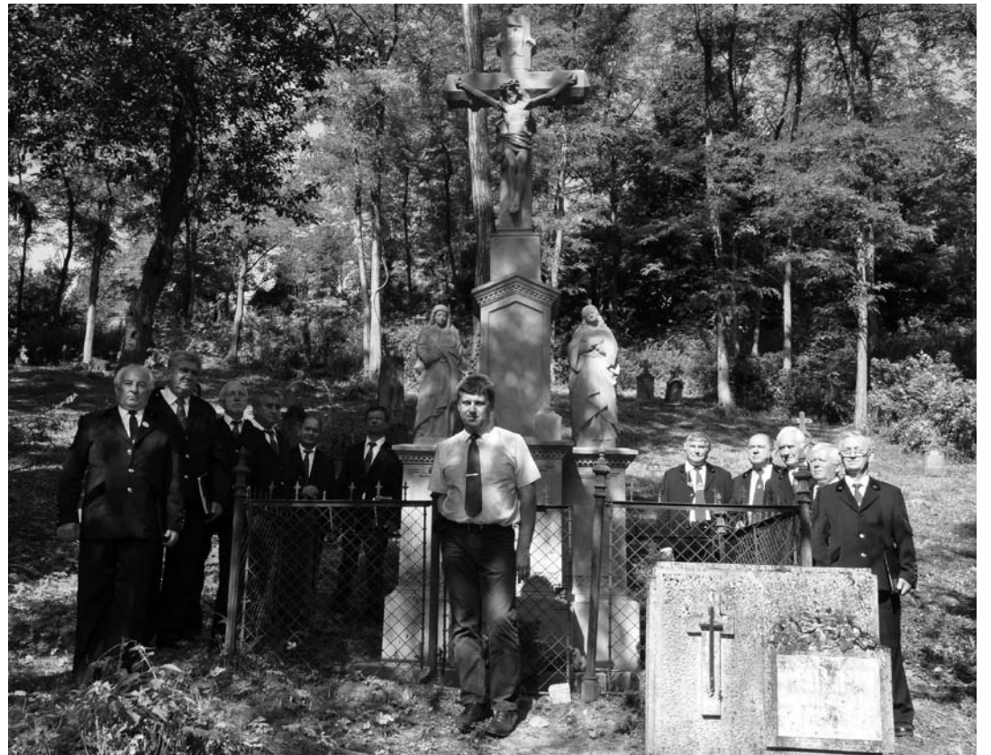
A felújított emlékkereszt és szobrok a felsőcsingeri temetőben.