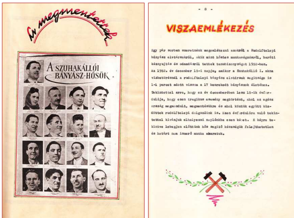
Egy rudolftelepi bányász szocialista brigágnapló megemlékezése a vízbetörés 15. évfordulójáról (1967)