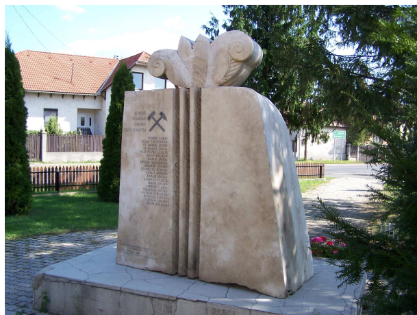
Emléktábla és Emlékkő Szuhakállói községben