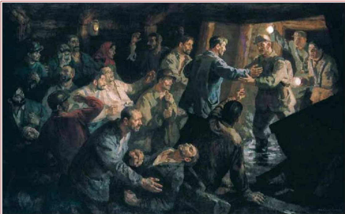
Mácsai István: A szuhakállói bányászok megmentése , 1953, olaj, vászon, 150x248 cm